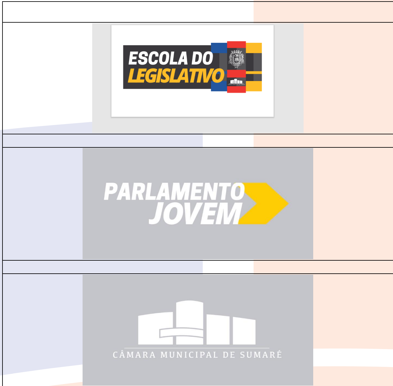
Imagem 3. ESTAMPAS: